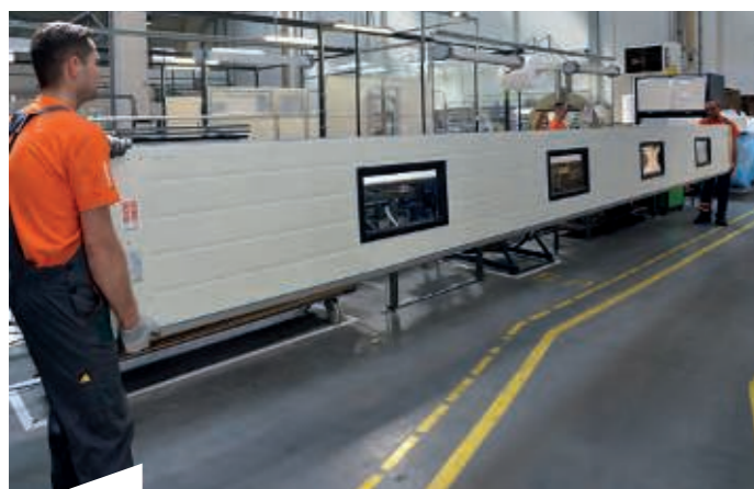
220 gut ausgebildete und hoch motivierte Mitarbeiter sorgen dafür, dass die hochwertigen KRISPOL-Produkte handwerklich perfekt gefertigt und pünktlich ausgeliefert werden.