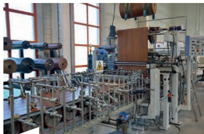
Modernste Maschinenteknik, hier eine Foliermaschine für Sektionaltor-Paneele, ermöglichen Spitzenqualität und zügige Fertigung.