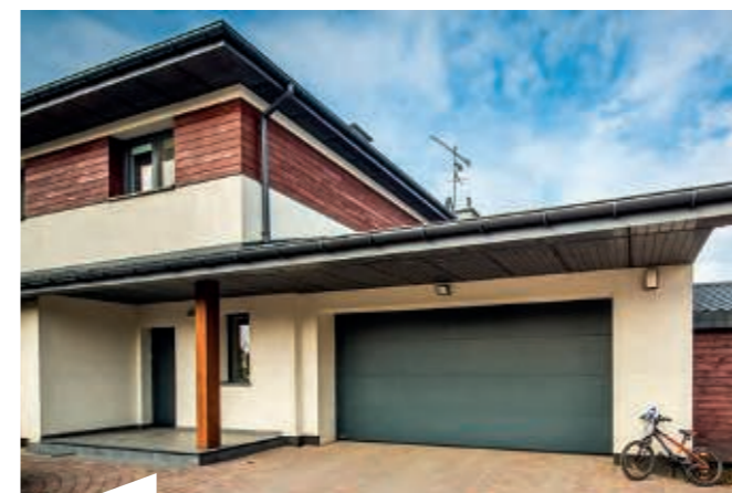
Alles aus einer Hand – Qualität und Design ohne Kompromisse: KRISPOL garantiert seinen Kunden, dass es zwischen Fenster, Haustür und Garagentor keinerlei farbliche Abweichungen gibt.

weiterten ERP-Systemen und durchgängiger CIM-Steuerung; es geht auch darum, hunderte von KRISPOL Salespoints in ganz Europa mit der A+W CANTOR Multitrade-Lösung an das System anzubinden und damit die Professionalität der KRISPOL Handels- und Montagepartner auf einen höheren Level zu heben – ein wichtiger Aspekt bei Markterschließung und Partnerbindung.