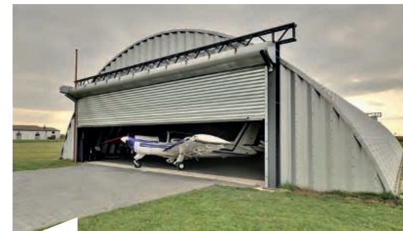
High-End Stahl Rolltor. KRISPOL formt die Profile selbst auf modernsten CNC-Maschinen und biegt die Schienen für die Sektionaltore – die außergewöhnliche Fertigungstiefe ist Voraussetzung für gleichbleibend hohe Qualität.

sondern auch aus derselben Charge stammt wie das Outfit der Fenster und Rollläden. Dafür hält KRISPOL sämtliche marktüblichen Folien bereit und verarbeitet sie mit modernsten Maschinen und höchstem handwerklichem Know-how.