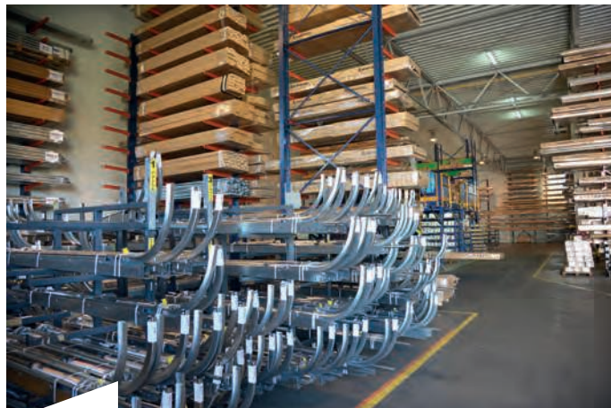
Auch die Lagerverwaltung für den Bereich Industrietore wird künftig mit A+W CANTOR erledigt: Neuland für die Projektteams, aber es ist geschafft, und der Livegang steht unmittelbar bevor.