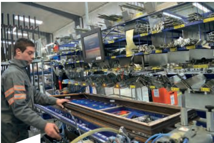
Beschlagsmontage, unterstützt von A+W CANTOR CIM. Das System zeigt dem Werker jedes einzelne Teil übersichtlich an und hilft auch hier, Fehler zu vermeiden.